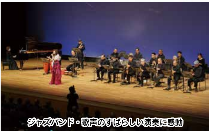
ジャズバンド・歌声のすばらしい演奏に感動