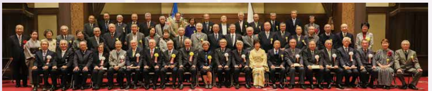
神奈川県老人クラブ連合会理事長表彰を受賞した皆様