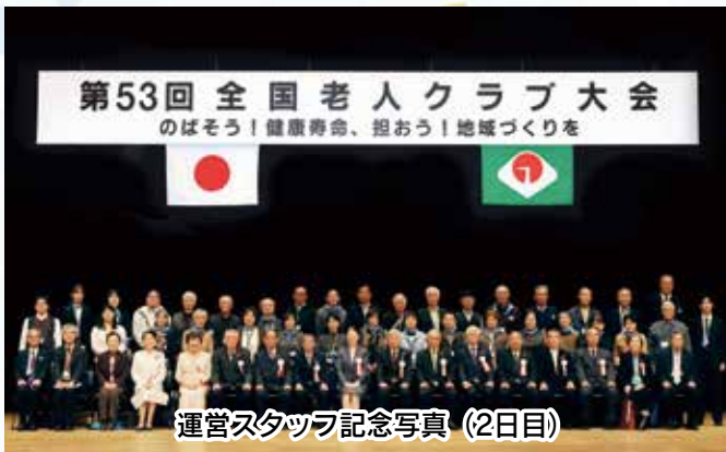
運営スタッフ記念写真（2日目）