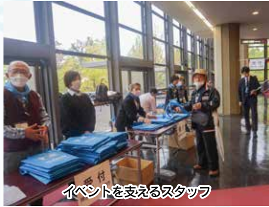
イベントを支えるスタッフ