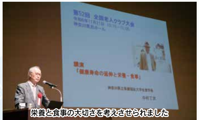
栄養と食事の大切さを考えさせられました