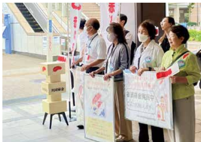
女性会議委員による桜木町駅前での 街頭募金活動