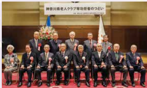
県知事表彰を受賞した皆様