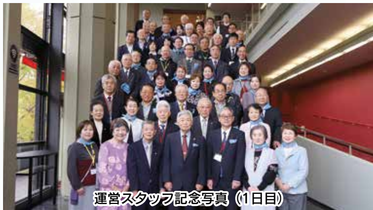
運営スタッフ記念写真 (1日目)