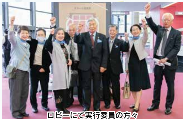
ロビーにて実行委員の方々

老人クラブ会員皆様の心に、何 かが残る大会であればと、時々 思いながら、川崎市老人クラブ 連合会と一緒に準備を進めてき ました。能登半島地震で被災さ れた地域のこと、高齢化が進む 全国の地域のこと、人と人との つながりを大切に日々の生活を 生きていく私たち、そしてささ やかでも老人クラブにできるこ とを、あらためて考えていただ ければと願っています。 最後に、大会運営にスタッフ としてご協力いただいた皆様、 ありがとうございました。心か ら感謝申し上げます。